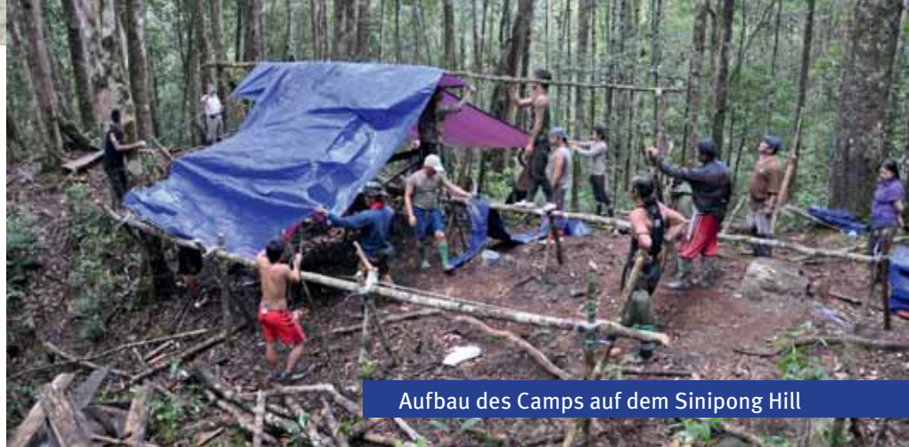
Aufbau des Camps auf dem Sinipong Hill

Weit und breit kein Urwald. Vereinzelt noch ein paar junge Teakbäume oder andere stehen gebliebene Gehölze, die aus den kilometerweiten Monokulturen aus Eukalyptus und Ölpalmen ragten. Dazwischen riesige gerodete Waldflächen. Ein Anblick, der einem in der Seele wehtat. Mächtige LKWs wurden mit Baumstämmen beladen, der Boden großflächig verschandelt – mit dem Segen der Regierung. Da, plötzlich ein freudiger Aufschrei: Im Gestrüpp am Wegesrand wurden ganze Gruppen stattlicher Arundina graminifolia in schönster Blüte gesichtet. Fotohalt.