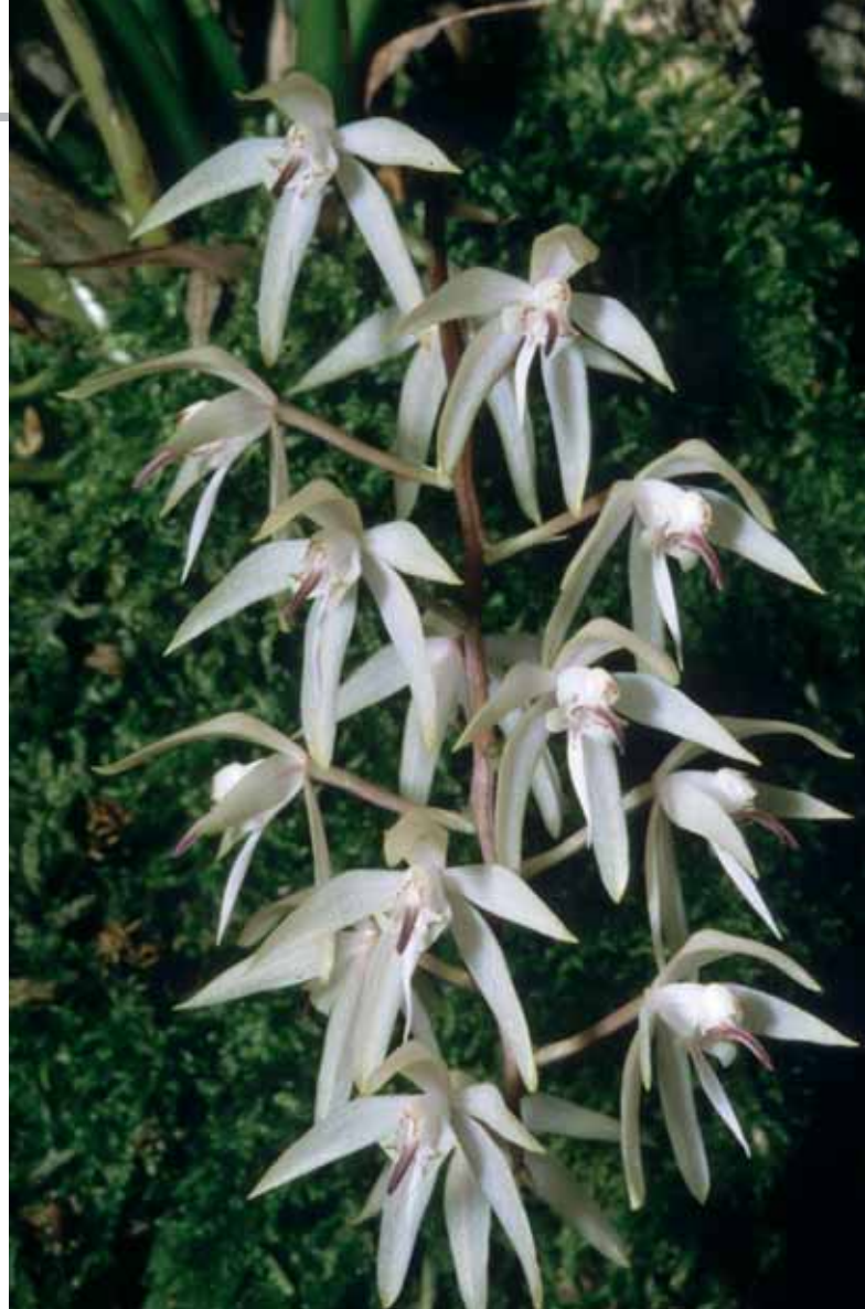
Macradenia purpureorostrata , Typus, Kolumbien, 94/3316