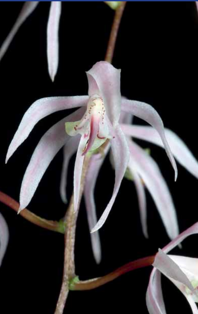
Macradenia purpureorostrata , Kolumbien, Dept. Caquetá, 08/2054

Wie bei den anderen Arten der Gattung Macradenia sind die Blüten nur